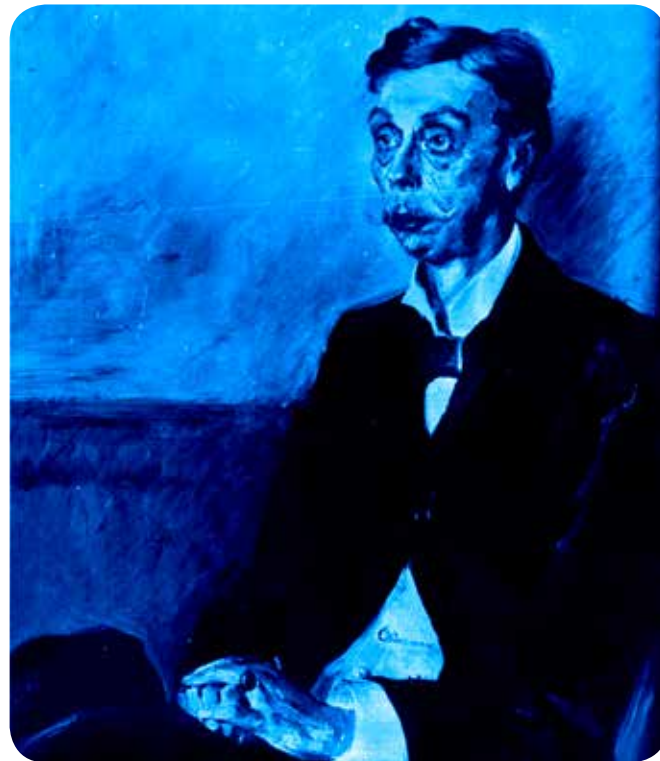
Eduard Graf von Keyserling

* 18. Mai 1855 auf Schloß Padden bei Hasenpoth (Aizpute) in Kurland;